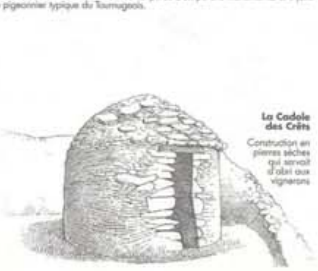
La Cadole des Crêts Construction en pierres sèches qui servait d'abri aux vigneronnes.