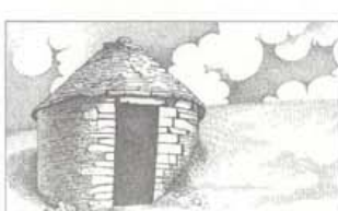
La cadole du moulin a été restaurée en 1999 par les bénévoles de l'association "Aux Écrouats".

Quatorze cadoles, généralement situées sur des propriétés privées, ont été recensées par l'association "Aux Écrouats" sur le territoire de la commune de Plottes. D'autres cadoles, certainement en mauvais état, doivent exister et sont cachées par la friche qui les envahit. À ce jour, deux cadoles, la cadole du moulin et la cadole des Crêts, ont été rénovées grâce à l'association "Aux Écrouats".