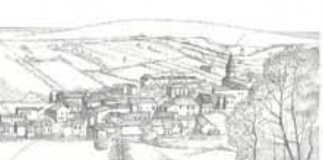
Vue sur Crêt et le village de Plottes depuis la porte ouest du sentier des Crêtes.