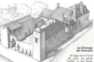
La Grange de Tremont La loge est en fond de cour. La porte "roule" à son bras, échappée de l'arcade à l'intérieur, est articulée d'une galerie à même cour d'une galerie à même cour.